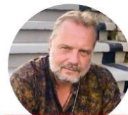
DIR. OLIVER LIONHEART "Black to Gold: Los Guerreros de la Verdad"