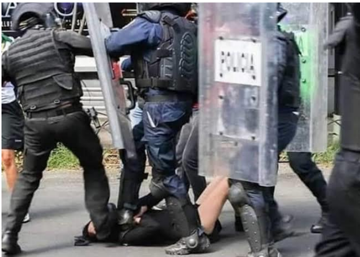
Granaderos, que “no existen”, reprimen protesta en la lucha por el agua en Xochimilco, en Marzo de 2023.

Luego, entonces, el pueblo protesta y lo que hace la jefa de gobierno es enviar 2 mil granaderos que, dicho sea de paso, dijeron que no existía ese cuerpo de granaderos, y como puedes ver en la foto, sí existen. ▀